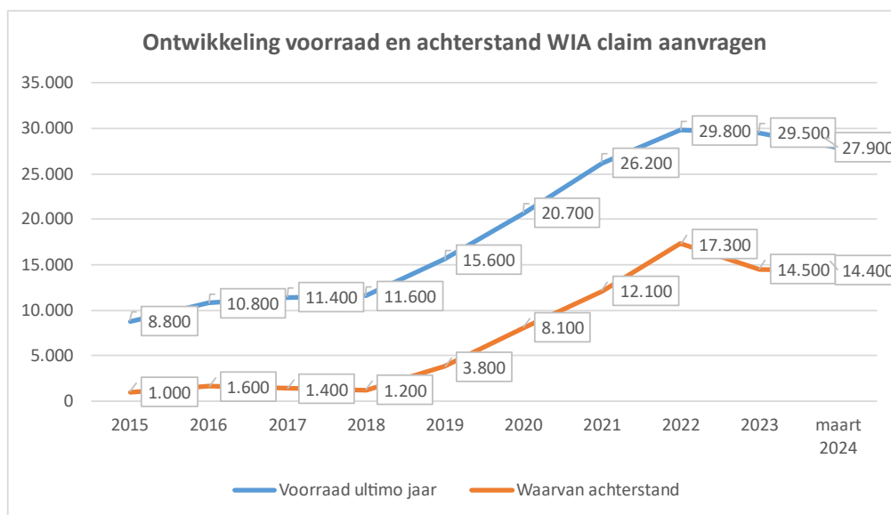
Figuur 2: ontwikkeling van de achterstanden bij de WIA-claimbeoordeling (aantal aanvragen waarvoor de wettelijke termijn van acht weken is verstreken) en van de totale werkvoorraad (aantal aanvragen nog binnen de wettelijke termijn plus de achterstanden).

Door extra inzet voor de mensen die lang wachten op een WIA-claimbeoordeling is het aantal mensen dat langer dan zes maanden wacht op een beoordeling verder gedaald. Medio 2023 ging het om 6.800 mensen en ultimo 2023 nog om bijna 3.100 mensen. In de eerste maanden van 2024 is er geen sprake van een verdere afname; ook in maart 2024 gaat het om bijna 3.100 mensen die langer dan zes maanden wachten. Deze stabilisatie is een gevolg van de toename van het aantal WIA-aanvragen. De inzet van UWV is om ervoor te zorgen dat eind 2024 nagenoeg niemand langer dan zes maanden op een beoordeling hoeft te wachten. 8